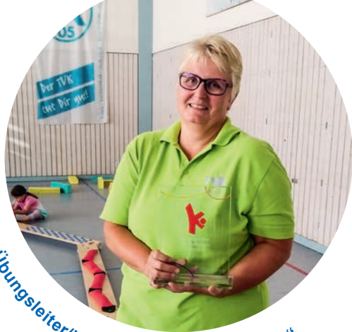
Auszeichnung „Übungsleiter/in Kinderturnen des Jahres“