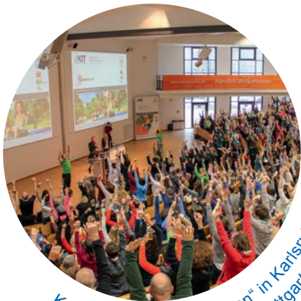
Kongress „Kinder bewegen“ in Karlsruhe und Kinderturn-Kongress in Stuttgart