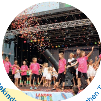
Landeskinderturnfeste des Badischen Turner-Bundes und des Schwäbischen Turnerbundes